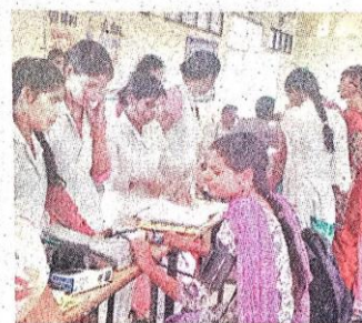
रक्त जांच शिविर में जांच कराती छात्राएं।