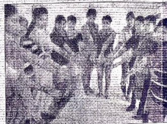
हाथ पर रवाई मेहंदी दिखाती छात्राएं।