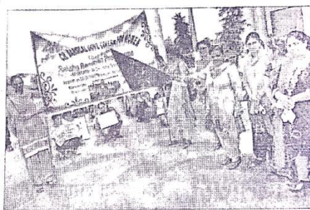
बंसीलाल महिला महाविद्यालय में रैली निकालती छात्राएं।