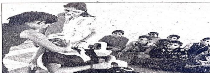
कार्यशाल के दौरान छात्राओं को ब्लीच व फेशियल करना सिखाते हुए।