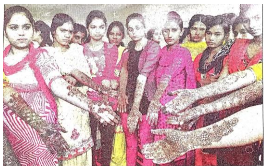
तोशाम। मेहंदी प्रतियोगिता में भाग लेती छात्राएं और बवानीखेड़ा राजकीय महिला महाविद्यालय में मेहन्दी प्रा